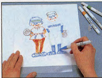
① 付属の油性ペンで絵を描く。