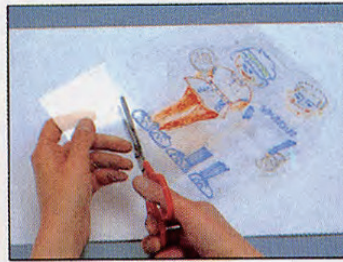
② ハサミで切る。 キーホルダーを作りたいときは 付属の穴パンチを使い、適当な場所に 穴をあけておく。