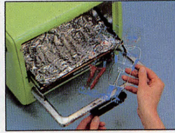
③ プラ板をのせる所にアルミホイルを のせ、オーブンに入れる。180℃で 1～2分。かなりクネクネと曲がるが 平らになるまで待つ。